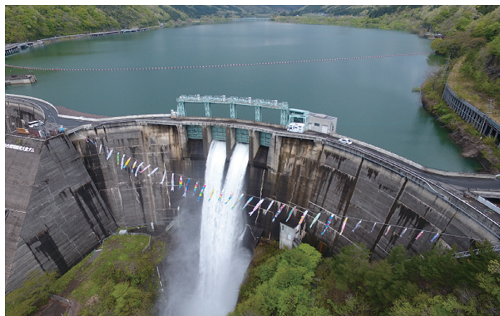
鯉のぼり×大倉ダム