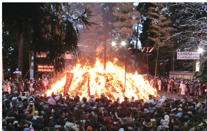
大崎八幡宮松焚祭