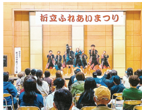
第21回『折立ふれあいまつり』 折立中学校「ソーラン隊」による踊り

この他沢山のイベントがありますが、今後とも様々なイベントを通じ地域の連携を図っていきたく考えています。